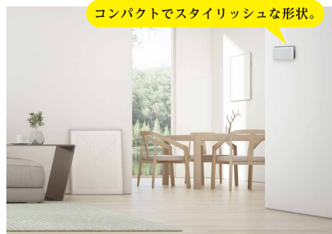
コンパクトでスタイリッシュな形状。

多くのオゾン発生器で採用されている「無声放電方式」はオゾン発生と同時に大気汚染の原因物質の1つでもある窒素酸化物（NOX）が発生します。トリニティーは窒素酸化物（NOX）が発生しない「紫外線ランプ式」を採用。より自然界に近い原理でオゾンを生産させます。